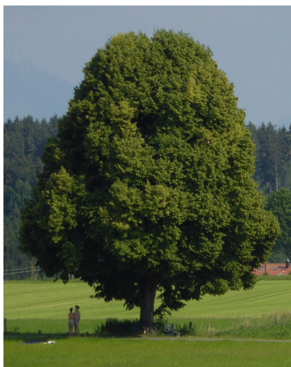
Die Linde - der prächtige Symbolbaum des Bund Naturschutz

Je mehr wir sind, desto mehr Spuren können wir hinterlassen.