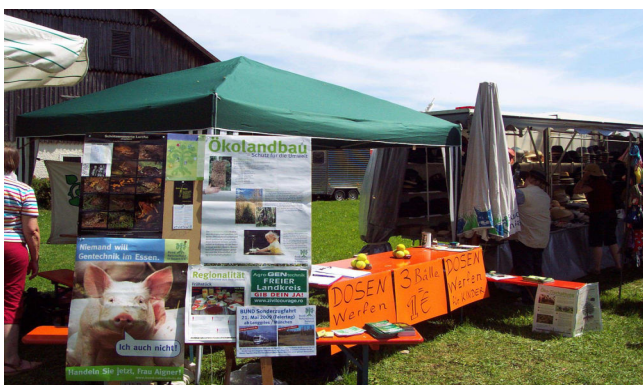
Erfolge – Niederlagen